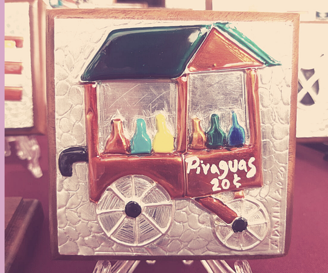
Foto de pieza que podías encontrar en la Feria de Artesanías y Artes Plásticas.