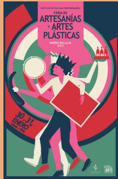
Promoción de Feria de Artesanías y Artes Plásticas.

Celebramos la Feria de Artesanías y Artes Plásticas durante dos días de manera presencial en el Barrio Ballajá, celebración unísona con las Fiestas virtuales de la Calle San Sebastián 2021.