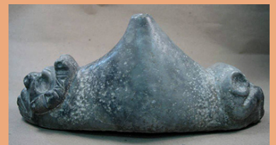
Foto de cemí que se encuentra en nuestro depósito.